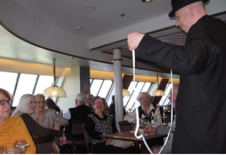
Yleisöllä on ilmeisen hauskaa taikurin temppuja katsellessaan.