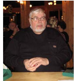
Annu pelasi Pekka P:n kanssa.