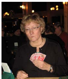
Annu pelasi Seijan kanssa.