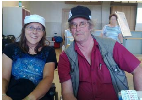
Lippispäät Hangossa 26.7.2013.